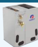
SERPENTIN EN A