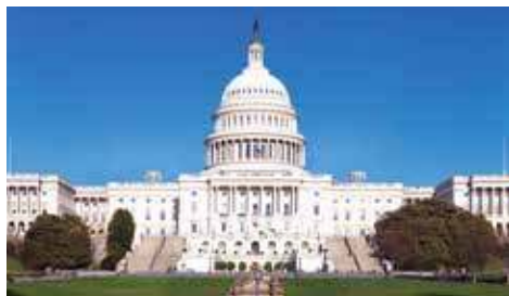
Le Capitole des États-Unis à Washington

Depuis plus de 140 ans, York conçoit et installe des systèmes de traitement de l'air dans les constructions parmi les plus prestigieuses au monde. Et depuis plus de 40 ans, York est la marque la plus choisie par les consommateurs canadiens lorsqu'il s'agit d'assurer confort en toute saison aux êtres chers. Rien de plus naturel que de confier son confort à York, car chaque appareil est conçu et fabriqué en Amérique du Nord sous étroite surveillance et selon les procédés de fabrication des plus sophistiqués, une assurance de la qualité et de la fiabilité des produits.