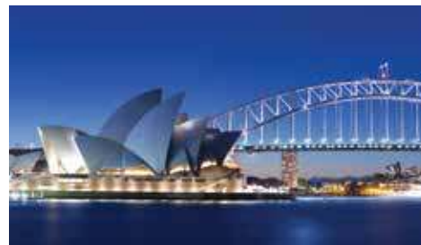
L'opéra de Sydney