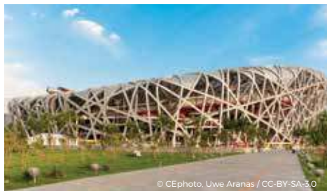
Le Stade national de Pékin